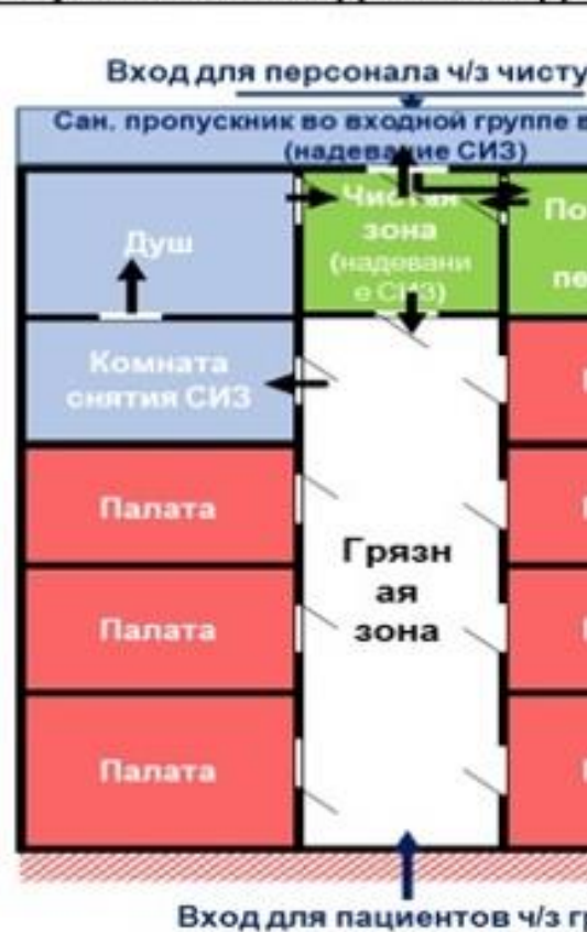
Схема модульного инфекционного стационара